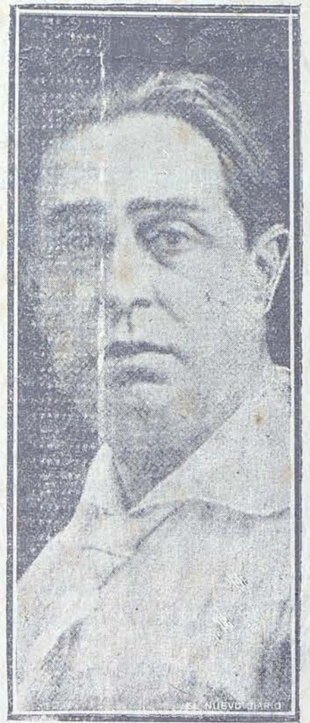
El señor José Juan Tablada.

Tal es, en breves líneas, la distinguida personalidad del nuevo Ministro de Méjico en Caracas; apuntes que hemos tomado de la prensa extranjera.