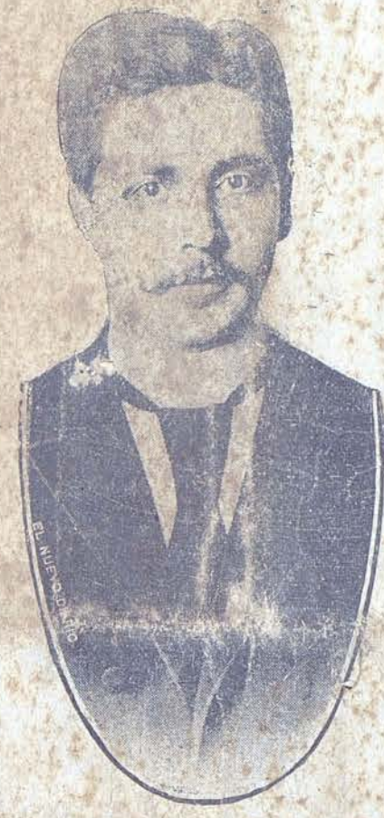
El doctor José Gregorio Hernández, al recibir el doctorado el 29 de junio de 1888.

El señor Presidente, expresó su condolencia a los deudos del finado y significó el sentimiento del Gobierno de la República por tan de-