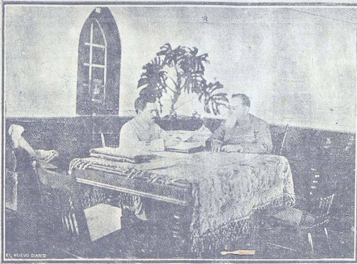
El Presidente Carranza y el Ministro de México en Caracas.

Muy joven aún, comenzó a distinguirse como periodista en los órganos de la Prensa de su Estado natal, y sostuvo en ellos vigorosas polémicas de carácter histórico y sociológico, que encontraron eco en las columnas de los diarios de la capital mejicana. Cuando en los últimos años de la Administración del Presidente Díaz comenzó a iniciarse el movimiento que acaudillado por el señor Madero, había de poner fin a ese gobierno, el señor Ugarte encontró en tal movimiento la aplicación natural de su amor juvenil a la justicia y al pueblo cuyos destinos iban a cambiarse. Entonces el señor Ugarte fue un ardiente